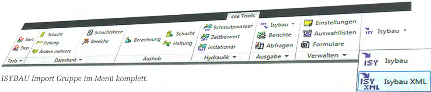
ISYBAU Import Gruppe im Menü komplett.